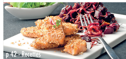
p 42 - Recettes