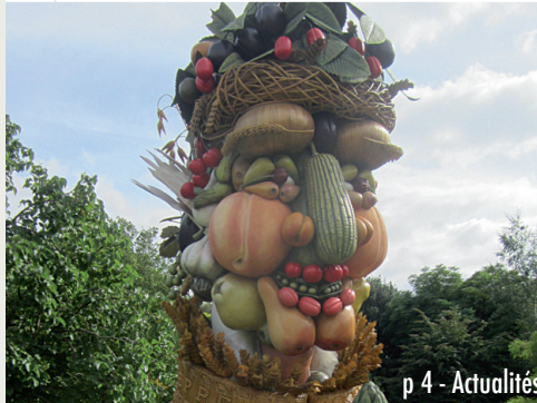
p 4 - Actualités